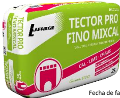
Fecha de fabricación y detalle del producto impreso en los laterales del saco